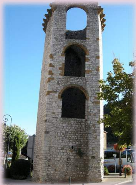
Tour de la Médiance

Fermé : 1 er /01 Lundi de Pentecôte Lundi de Pâques 1 er /05 1 er et 11/11 25/12